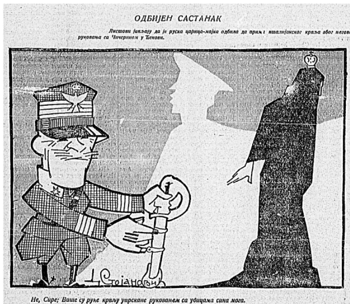
Карикатура бр. 2 (Време, 23. 7. 1922)